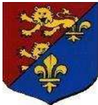
Esquisse de notre emblème