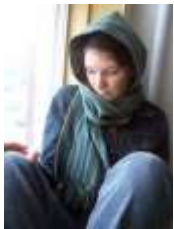
foulard à capuchon.

Je vous invite à découvrir de jeunes tisserandes d'ici qui sont tout à fait géniales ! Allez jeter un œil sur leur site. Je suis certaine qu'elles vous donneront le goût de magasiner ! Leurs produits sont faits au métier à tisser à partir de fibres biologiques.